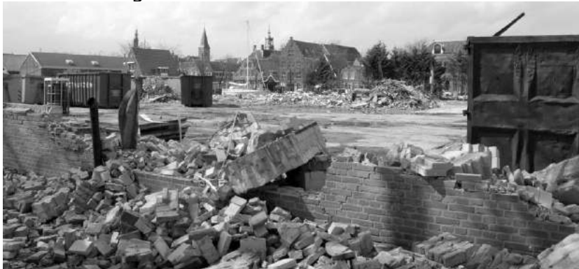
De afbraak van het Körsnas-terrein met op de achtergrond de Nieuwehaven, Edam.