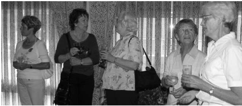
Dames van de werkgroepen en van het bestuur tijdens het eerste lustrumviering in juni 2007 in Bowlingcentrum "De Zedde" in Volendam.

Met ruim 1400 bezoekers per jaar kan gesteld worden dat de website in een behoefte voorziet.