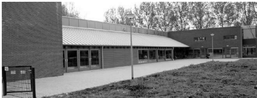
Het Welzijnsgebouw De Singel aan de Keetzijde in Edam.