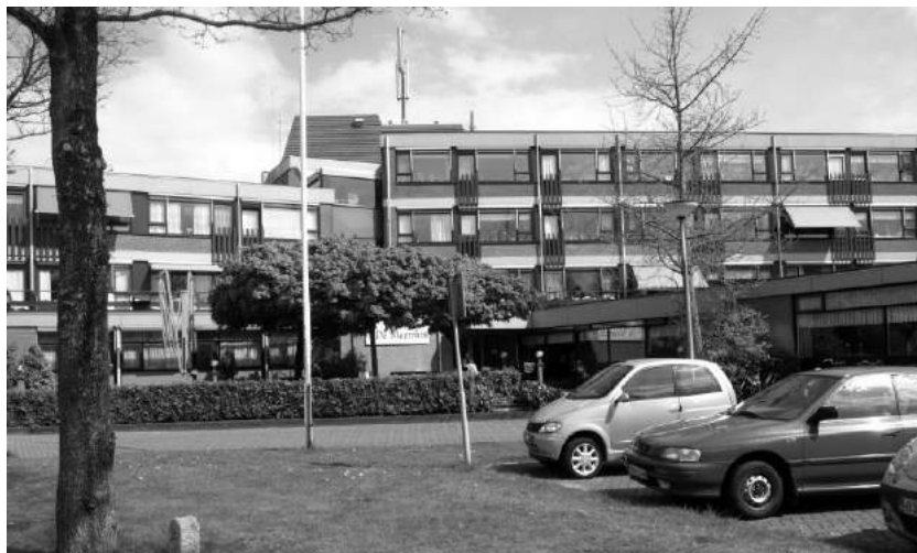
Woon- en Zorgcentrum De Meermin in Edam.