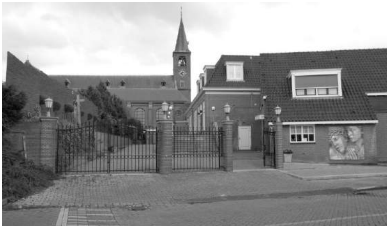
Ingang Kerkhof aan de C.J. Conijnstraat, Volendam

Ons volgende project was om veilige routes te creëren rond het St. Nicolaashof. Tezamen met de vestigingsmanager van het Sint Nicolaashof is een enquête gehouden onder de bewoners hiervan, onder de bewoners van de aanleunwoningen en die van de Roerstraat. Wij hebben aan het einde van dit jaar een advies over een veilige route naar de markt, de supermarkten, het kerkhof en de dijk ter goedkeuring aan hen voorgelegd en hopen dit na hun goedkeuring in de loop van januari 2008 door te sturen naar ons gemeentebestuur.