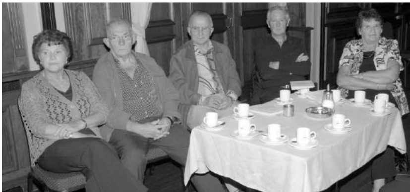
Aanwezigen tijdens de Informatiemiddag Senioren in oktober 2007.

Dit geldt zowel voor de organisatie als de huisvesting. Ook financieel zal het grote inspanningen vergen als het gaat om de aanschaf- en inrichting van busjes.