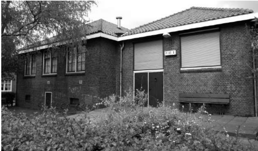
Het PIUS-X Gebouw