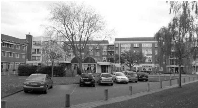
Zorgcentrum St. Nicolaashof, Volendam

Bovendien zijn de suggesties direct opgenomen in het nieuwe verbeterplan. Ook is er overleg geweest met de werkgroep Mobiliteit en Veiligheid van de Seniorenraad. Zij gaat zich inzetten voor de veiligheid van de bewoners die met behulp van een rollator of rolstoel een wandeling willen maken of een bezoek brengen aan het graf. De tekeningen waren prima. Nu maar hopen dat het gemeentebestuur van Edam-Volendam het gaat realiseren.