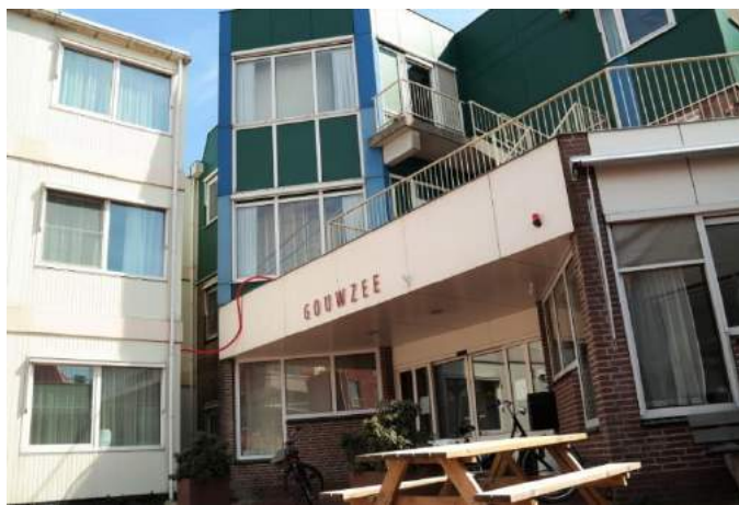
De Gouwzee Volendam

Uw partij ijvert voor ondersteuning van mantelzorgers en vrijwilligers, zodat ze niet overbelast raken.