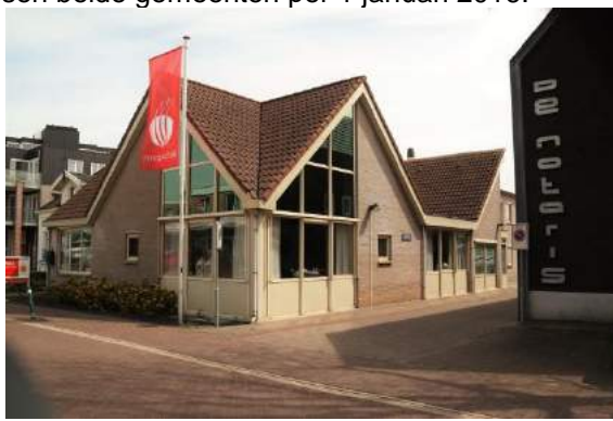
Oosthuizen De Notaris