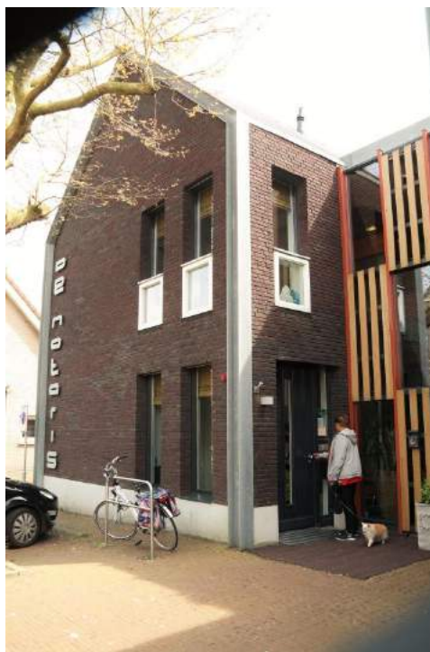
Verzorgingshuis De Notaris - Oosthuizen