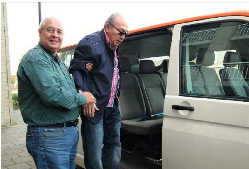
Project 60+ bus

Uitgangspunt inzake een seniorvriendelijk beleid hierbij is geweest de formulering van tien speerpunten voor een seniorvriendelijk beleid in de gemeente Edam-Volendam die aan de politieke partijen gepresenteerd zijn in de aanloop naar de gemeenteraadsverkiezingen op 18 november 2015. De politieke partijen hebben deze en andere voor senioren vriendelijke thema's al dan niet uitdrukkelijk in hun verkiezingsprogramma's opgenomen.