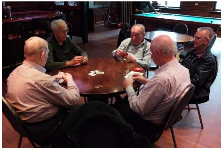
Kaartje leggen in het Gebouw St. Jozef