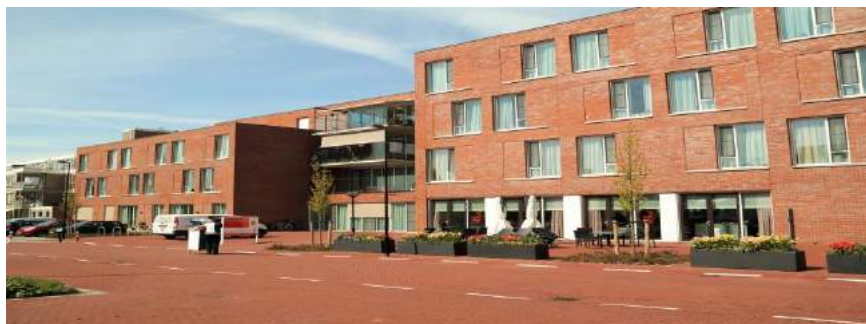
St. Nicolaashof - Volendam

Met een goede communicatie, goed beleid en onderlinge samenwerking ziet hij de toekomst van de zorg in onze gemeente met vertrouwen tegemoet.