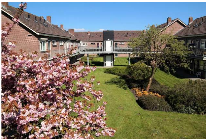
Wooncomplex Ye - Edam