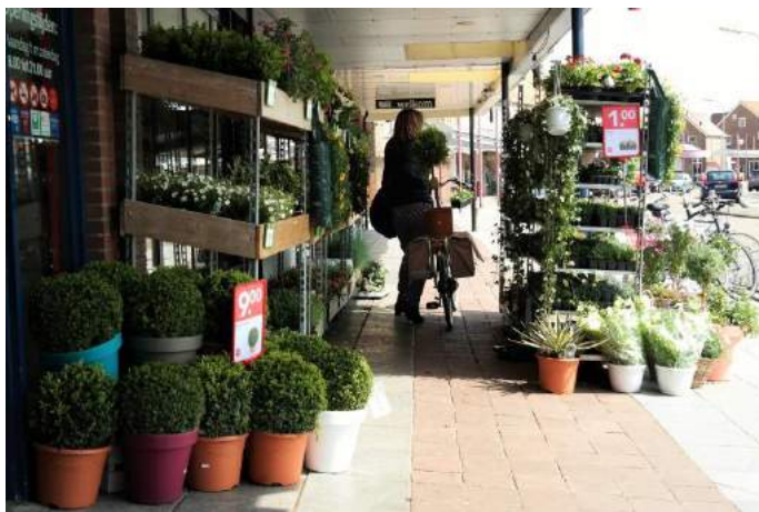
Moeilijk voor scootmobielen in de Burgemeester van Baarstraat

Tevens zijn leden van de werkgroep op pad geweest om de toegankelijkheid van de openbare gebouwen en bedrijven in onze gemeente verder in kaart te brengen.