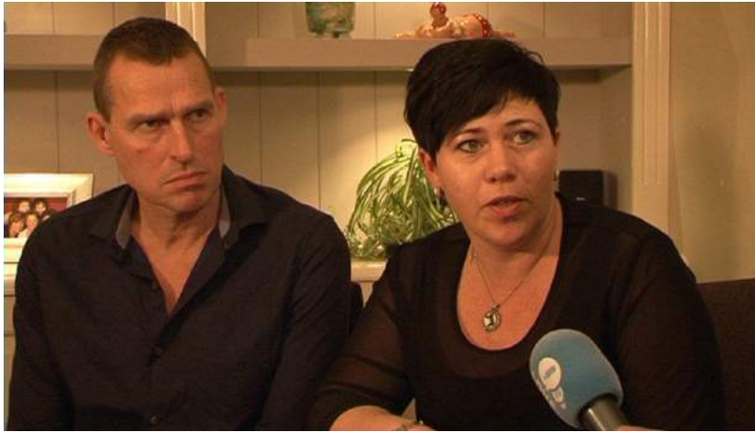
Beeld uit de 100-min en ouder uitzending over Erfelijke ziekten Volendam

Tevens is het jaarverslag 2014 van de Seniorenraad in de NIVO en De Stadskrant gepubliceerd.