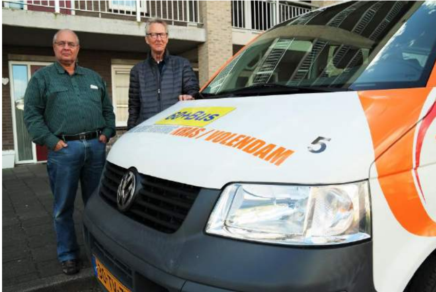
Project 60+ Bus

Ik hoop dat u uw voordeel weet te doen met de aangeboden informatie in ons jaarverslag, met name wanneer u antwoord zoekt op zorgvragen die samenhangen met wonen, veiligheid, welzijn, mobiliteit enz.