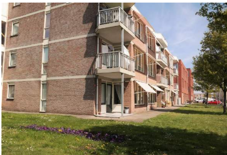
St. Nicolaashof - Volendam

Alles bij elkaar een actief jaar voor onze (te) kleine werkgroep, echter voor de senioren zonder zichtbare resultaten. In dit soort zaken heb je lange adem nodig. Laten wij hopen dat dit ons gegeven wordt en dat de komende tijd voortgang zal brengen in de volbrenging van senioren-huisvesting.